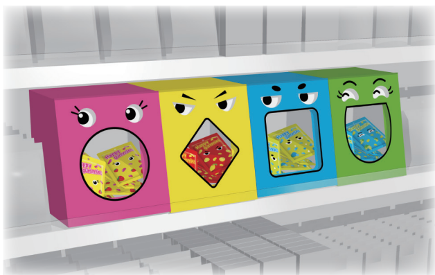
展開イメージ 定番棚