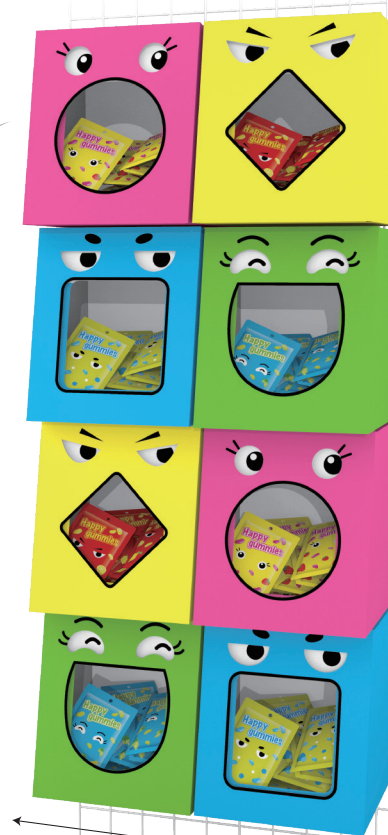
8ヶ設置 した場合の 参考サイズ